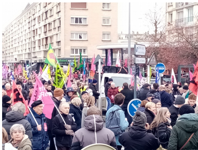
Manifestation du 19 janvier 2023 à Caen

Pour sauver notre système de retraites par répartition ? Hum, après avoir cherché à mettre en place un système par points, Macron voudrait sauvegarder le système actuel ? Une chose n'a pas changé : la volonté de diminuer la part des retraites dans le PIB et dans l'immédiat il faut financer la future suppression de la cotisation des entreprises sur les valeurs ajoutées : 8 Milliards d'euros. Tiens donc.