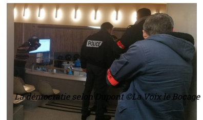
La démocratie selon Dupont

Cherchez l'erreur... Les idées pleuvent et se heurtent. Les petits chimistes s'amuse, tant pis si les élèves explosent.